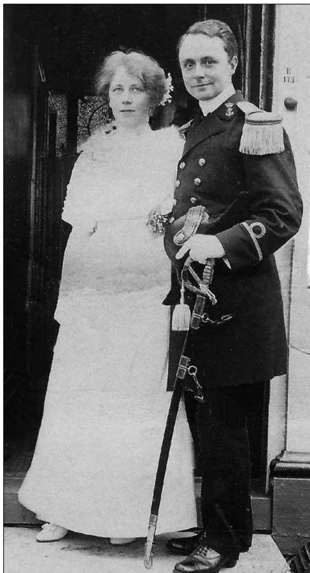
De trouwfoto.