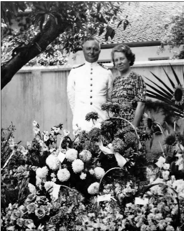
Het echtpaar Stöve tijdens de laatste jaren in Indië.

Dadelijk na de bevrijding vestigde hij het Commandement der Zeemacht Nederland in Den Haag, tegelijk met de Geallieerde Britse 'Flag Officer Holland'. In nauwe samenwerking met de Engelse Marine werd gezorgd voor het openen van de Nederlandse zeehavens, het mijnenvrij maken van de visserijgebieden, het terughalen van de vaartuigen uit Duitsland en allerlei andere verrichtingen ten behoeve van de scheepvaart. Tevens was hij betrokken bij het weer op gang brengen van het havenbedrijf en de voedseltoevoer. Op 1 mei 1946 werd hij definitief bevorderd tot Vice-Admiraal, nadat hij op 10 juli 1945 al tijdelijk bevorderd was tot die rang.